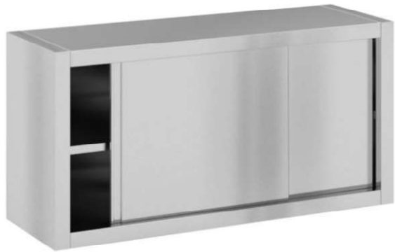
N3 – 1 ks – 1200x400x600 mm m. č. 590