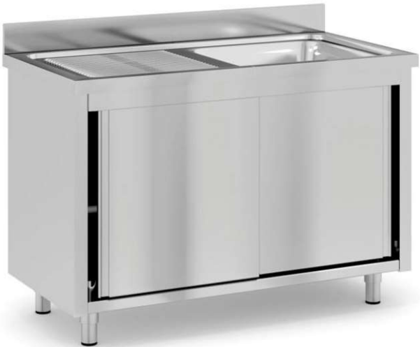
N1 – 1 ks – 1200x600x850 mm m. č. 590